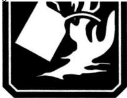
FUEGO CLASE B