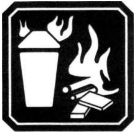
FUEGO CLASE A