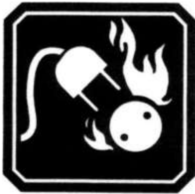
FUEGO CLASE C .

iv. Clase D: Son fuegos en metales combustibles y sus aleaciones, tales como, magnesio, aluminio, titanio, circonio, sodio, litio, y potasio.