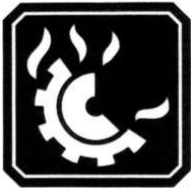
FUEGO CLASE D .

iv. Clase D: Son fuegos en metales combustibles y sus aleaciones, tales como, magnesio, aluminio, titanio, circonio, sodio, litio, y potasio.